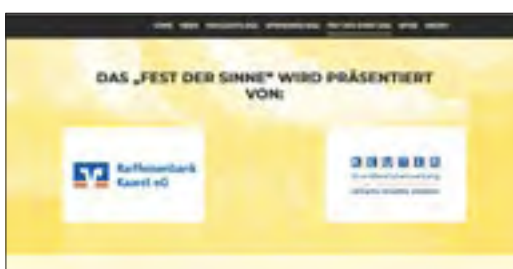
Schriftlicher Zusatz auf der Website auf den Seiten des Abends