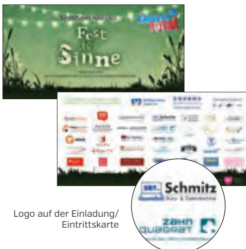
Logo auf der Einladung/ Eintrittskarte