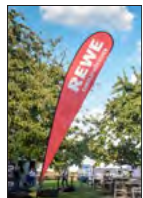
Aufstellung mehrerer Werbemaßnahmen am Abend