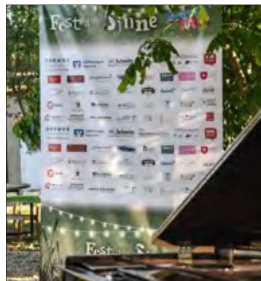
Logo auf der Sponsoren-Wand am Abend