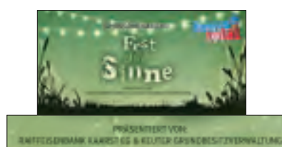
Schriftlicher Zusatz auf der Einladung und den Eintrittsbändchen