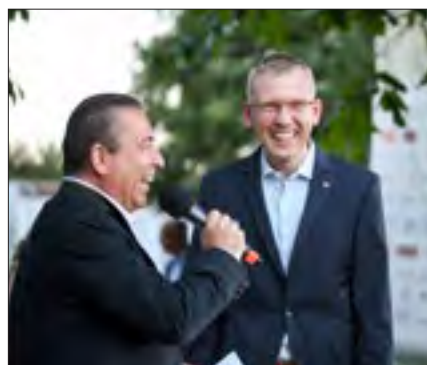
Persönliche Vorstellung als Sponsor bei der Begrüßung